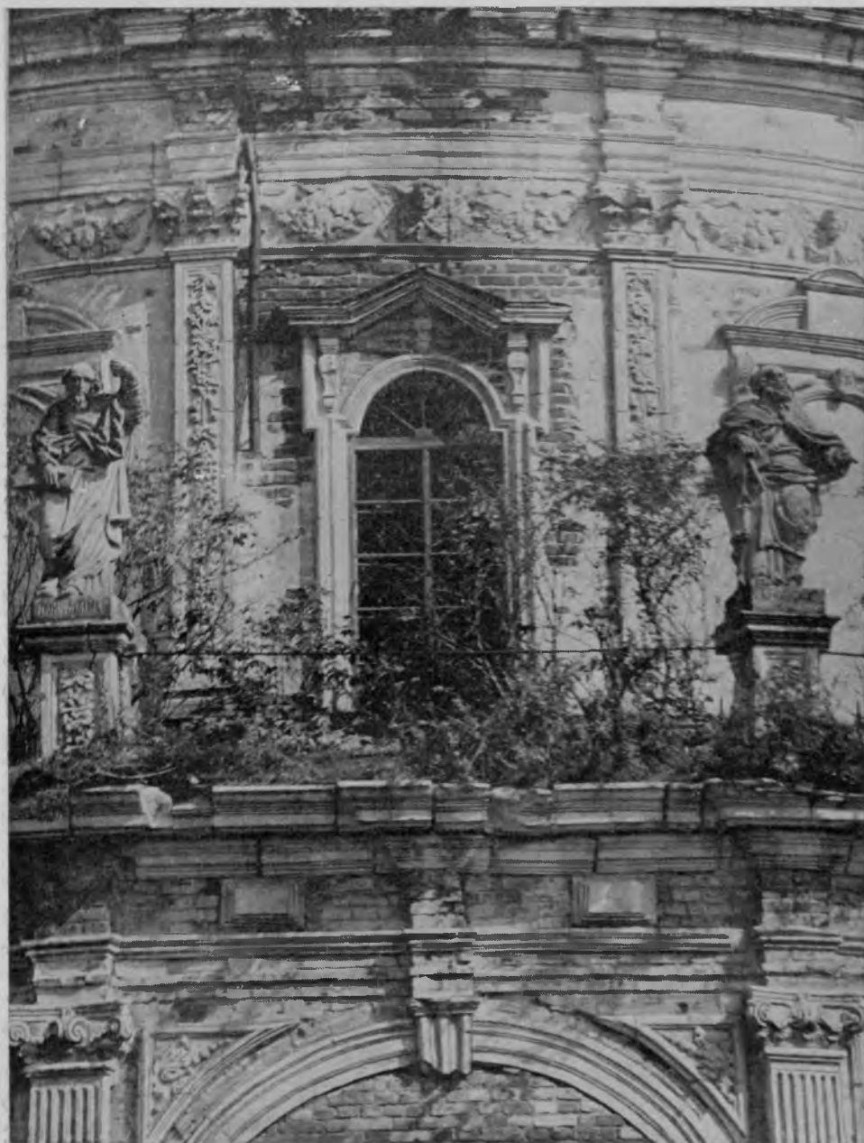
Апостолы Петр и Павел. Скульптуры на фасаде церкви Рождества Богородицы