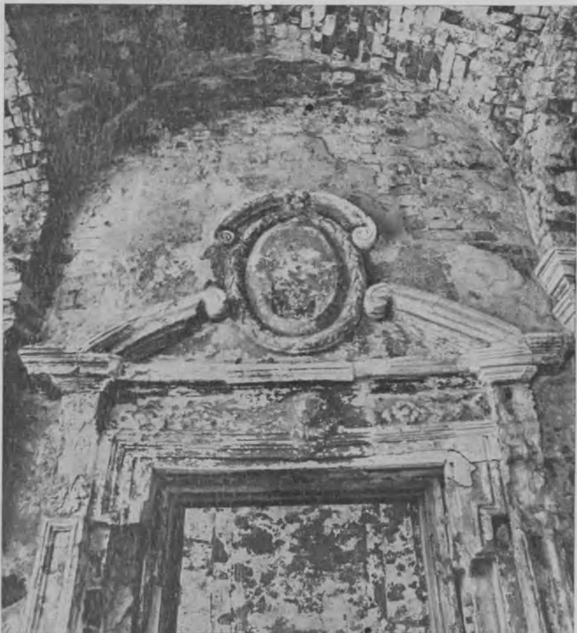
Церковь Рождества Богородицы. Западный портал