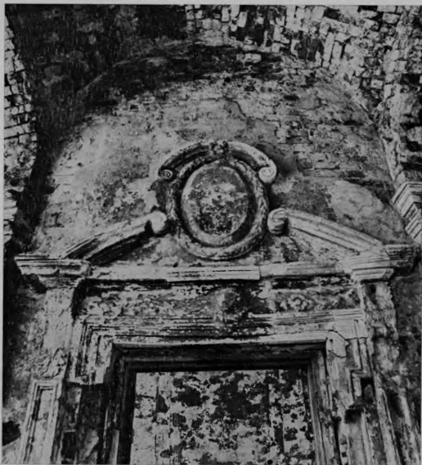
Церковь Рождества Богородицы. Западный портал